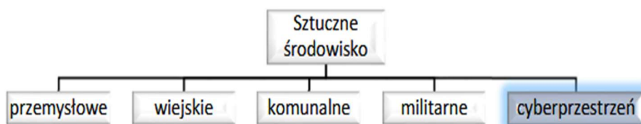
Rys. 2. Podział sztucznego środowiska