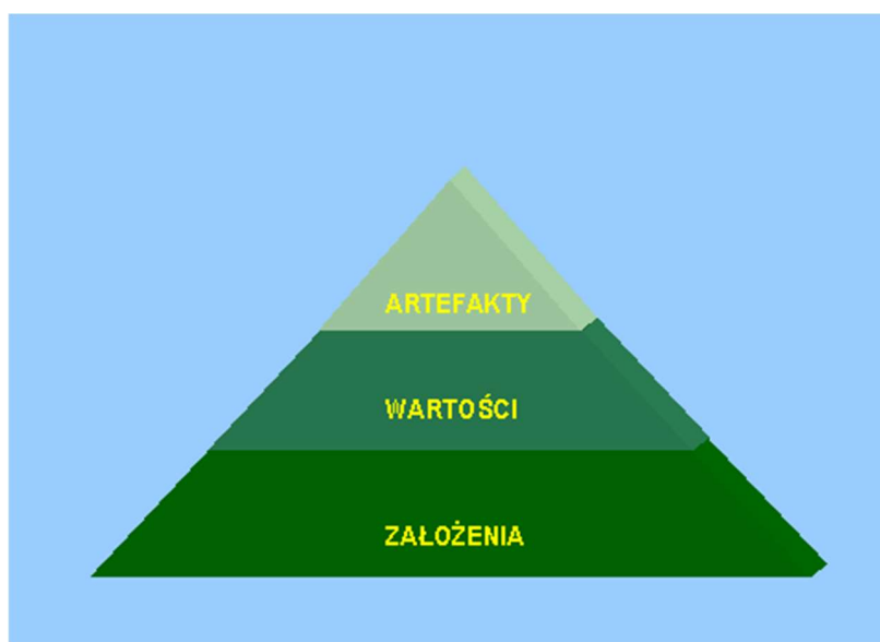
Rys. 3. Model kultury według Scheina

Istotnym rozwinięciem tego podejścia jest zwrócenie uwagi przez jej autora na wielowarstwowość, wielopoziomowość kultury, którą porównuje się do góry lodowej, gdzie część poziomów jest widoczna gołym okiem, inne natomiast są głęboko zanurzone w oceanie, dlatego trudno jest do nich dotrzeć i je poznać (obrazuje to rysunek 3) 24 .